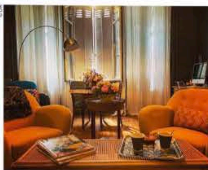
LA CHAMBRE D'HÔTES LE REZ-DE-JARDIN.