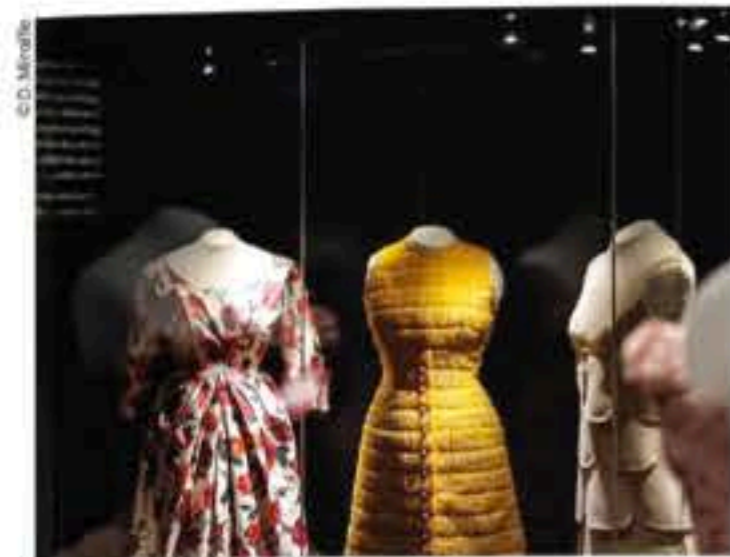
LE MUSÉE DE LA MODE.