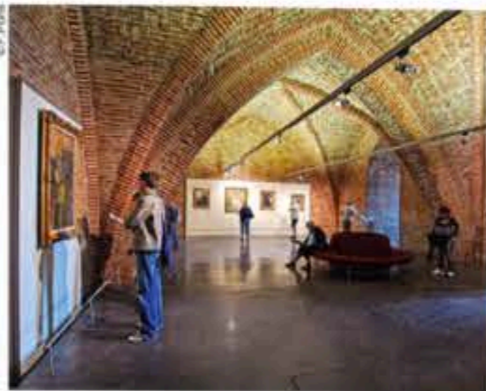
LE MUSÉE TOULOUSE-LAUTREC.